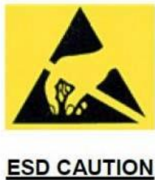
图 7-1 防静电处理

模块为静电敏感器件，请注意运输和生产过程中的防静电处理。切勿随意用手触摸或用非防静电烙铁进行焊接，以免损坏模块。